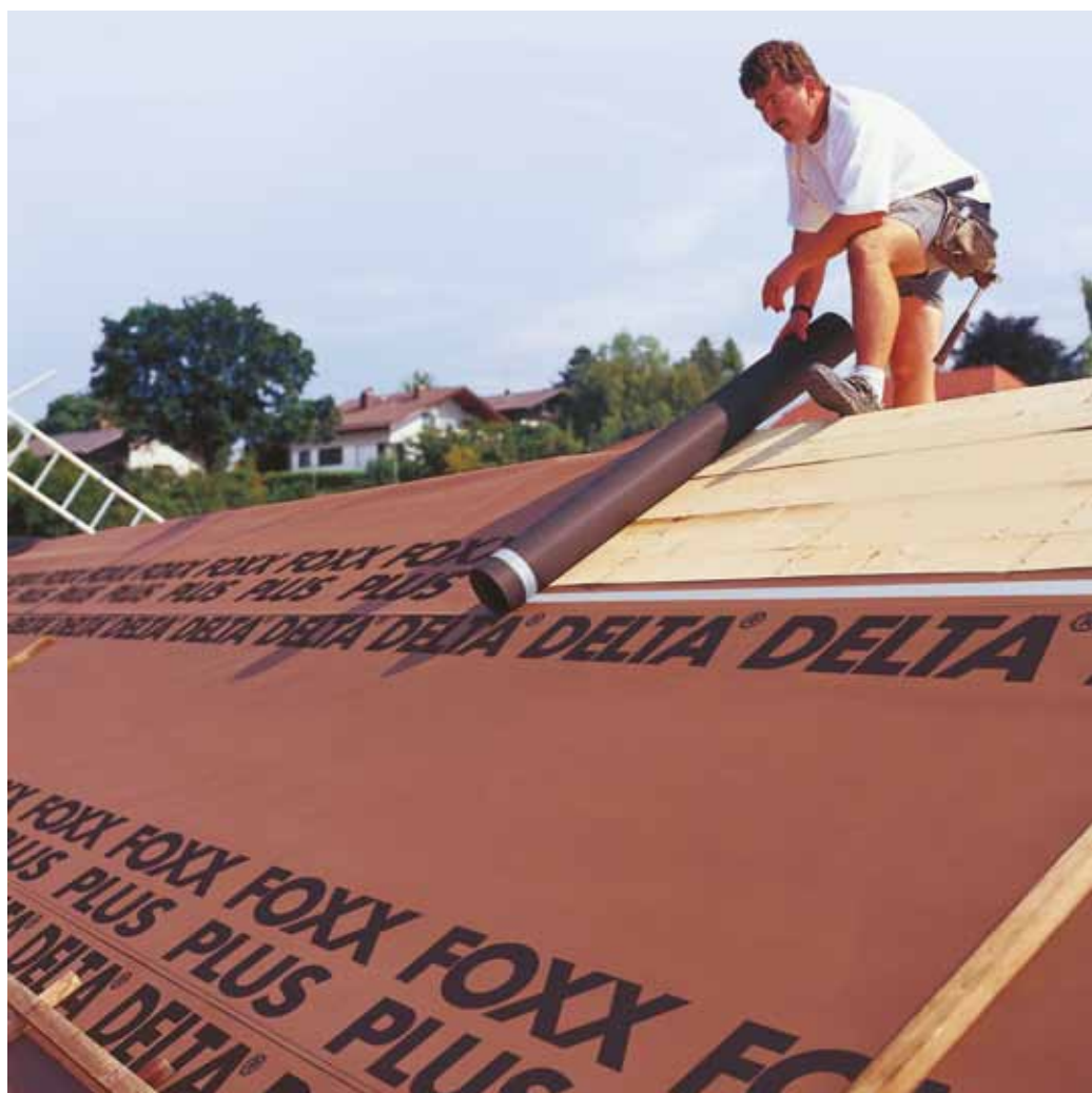
Плётка DELTA®-FOXX PLUS сохраняет вашу мансарду комфортной и сухой на весь срок эксплуатации.