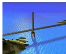
Мост Agin (TR)