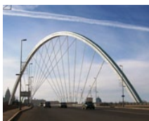
Мост Рамстор (KZ)