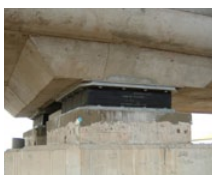
LASTO®LRB & HDRB