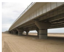
П/п Аваза 1300 (TM)