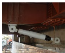
RESTON®SA & STU