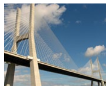
Мост Vasco da Gama (PT)